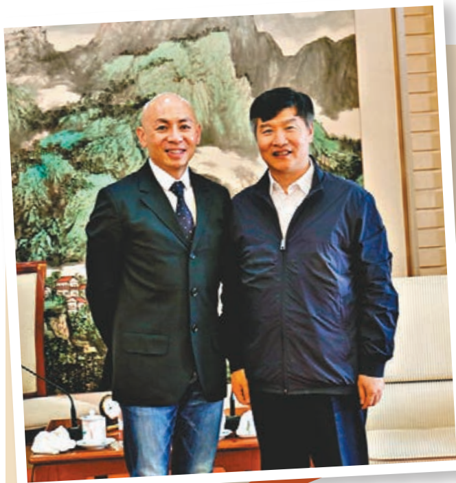
交通運輸部副部長劉小明對林超賢導演充滿信心。