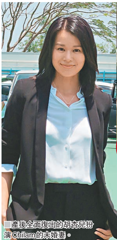
產後全面復出的胡杏兒扮演Chilam的未婚妻。