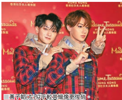
黃子韜(左)似乎較其蠟像更俊俏。

香港文匯報訊(記者吳文釗)前EXO成員黃子韜(Tao)昨日到山頂的杜莎夫人蠟像館出席其蠟像揭幕儀式，適逢昨天是其25歲生日，現場