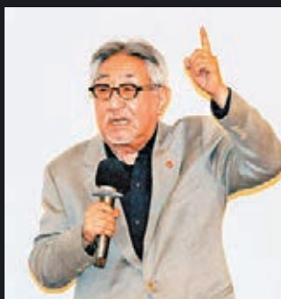
孫越因敗血症併發多重器官衰竭不治。

越成功戒掉37年煙癮，但仍在2007年被診斷出肺腺癌，接受手術後近年發展成慢性阻塞性肺病，經常要進出醫院。