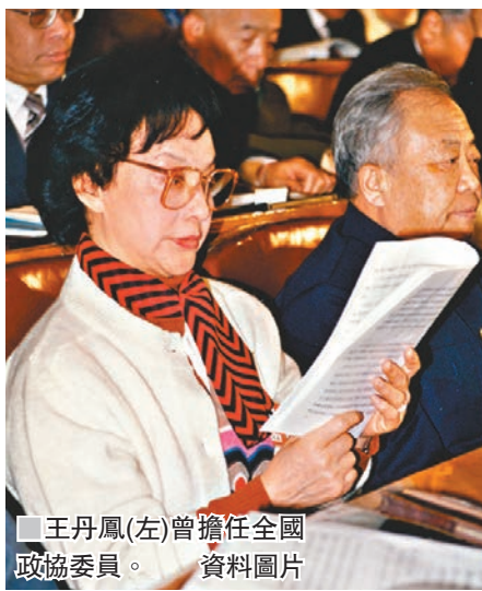
王丹鳳(左)曾擔任全國政協委員。