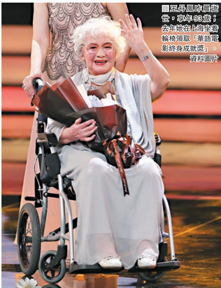
王丹鳳(左)曾擔任全國政協委員。