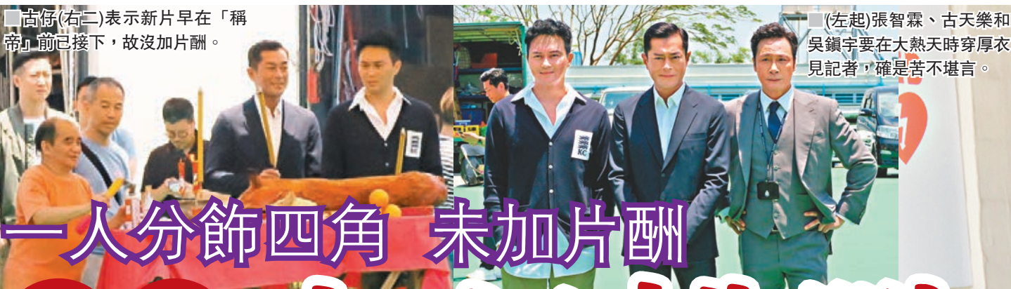
古仔(右二)表示新片早在「稱帝」前已接下，故沒加片酬。