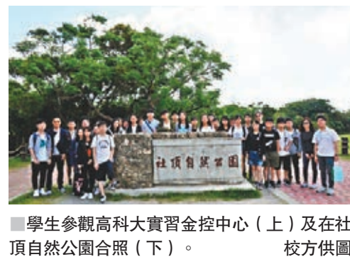
學生參觀高科技大實習金控中心（上）及在社頂自然公園合照（下）。