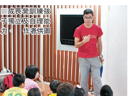
成長營訓練孩子獨立及自理能力。作者供圖

如果各位年輕人希望對工作世界及對自己有多些認識，可參與女青生涯規劃服務隊（香港島及離島）的工作體驗及實習計劃，詳情將上載於facebook ( https://www.facebook.com/hkywcaclap )，歡迎大家報名參加。