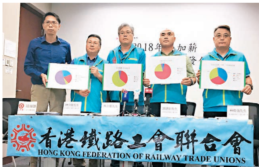
香港鐵路工會聯合會昨日公佈2018年度加薪問卷調查，逾六成的港鐵工會會員工期望今年加薪7%至8%。

香港文匯報訊(記者 何寶儀)工會香港鐵路工會聯合會昨日發表2018年度加薪問卷調查結果。結果顯示，逾六成的港鐵工會會員工期望今年加薪7%至8%，並有接近七成人認為應改善夜班津貼。工會指出，資方2003年以共度時艱為由，削減員工的夜更津貼，惟今天營運環境好轉，坐擁逾百億元盈利，津貼幅度卻追不上以往水平。