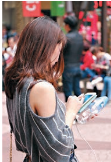
政府未有廣泛應用雲端，市民無法全面分享大數據帶來的便利。