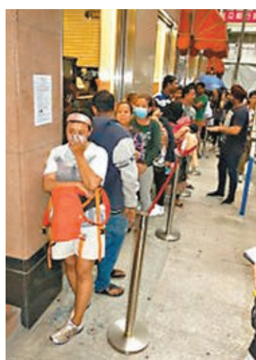
城市售票網仍未「衝上雲端」，連累購票的市民要捱排隊之苦。