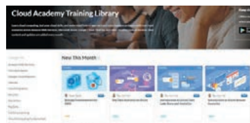
Cloud Academy 在網上提供逾千個影片課程、測驗及實驗室，讓用戶隨時隨地自主學習。