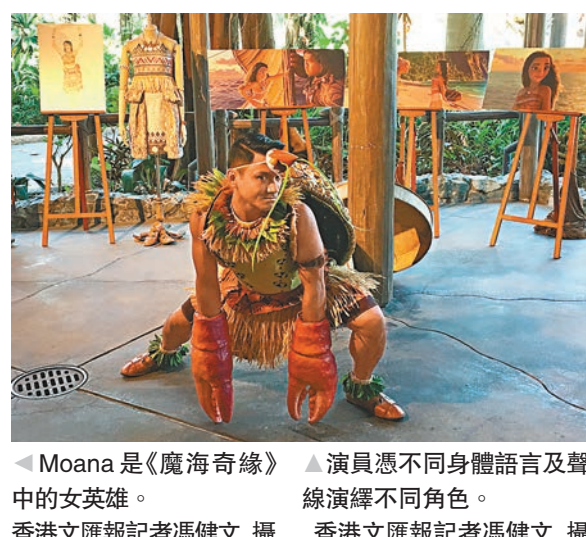
Moana是《魔海奇緣》演員憑不同身體語言及聲音中的女英雄。

香港文匯報訊(記者 馮健文)香港迪士尼樂園最新擴建計劃首個項目、「魔海奇緣凱旋慶典」舞台表演，將於本月25日起在樂園最新建成的樂韻叢林登場。