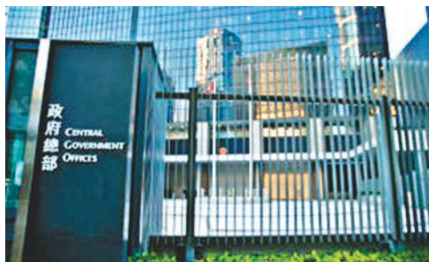
港府斥巨資推新一代雲端設施和大數據平台，但要2020年才開始運作。