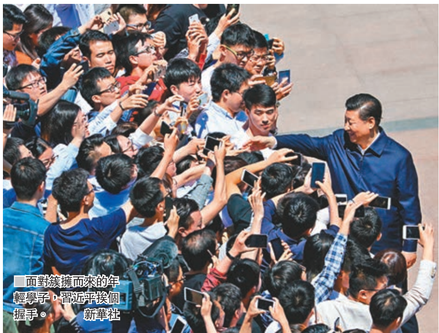
面對簇擁而來的年輕學子，習近平挨個握手。