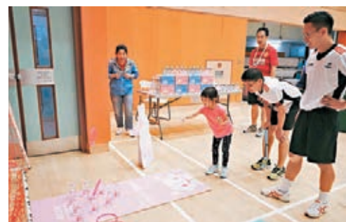
今年新增親子體驗項目。

香港文匯報訊(記者 高鈺)教聯會第十一屆教師體育節今年吸引了來自全港200多間學校、超過1,400名健兒參加乒乓球、羽毛球、足球、籃球、躲避盤等比賽。大會今年新增親子體驗項目,包括旱地冰球、穿雲箭、室內單車及家庭羽毛球等,廣受教師歡迎。