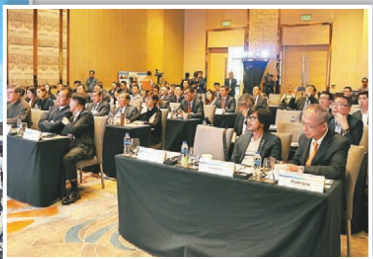
▲ 港滬的投資、金融及專業服務界代表，在非國與當地發展商及項目擁有人交流，探討雙方合作機會。