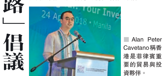
▲ Alan Peter Cavetano稱香港是菲律賓重要的貿易與投資夥伴。

代表團在4月23日至24日到訪馬尼拉期間，拜訪菲律賓國家經濟發展署、菲律賓經濟特區管理局、菲律賓貿易及工業部等政府部門，並與當地商界領袖及項目擁有人會面。另外，港滬兩地的投資、金融及專業服務界代表亦在多場交流活動中，與當地投資機構及項目擁有人深入探討基建發展合作的機會。