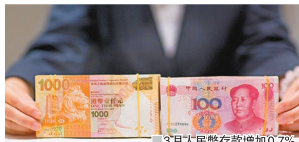
■ 3月人民幣存款增加0.7%或約38億元。資料圖片

香港文匯報訊 香港金管局昨發表的統計數字顯示,今年3月份認可機構的存款總額減少0.4%。由於儲蓄存款的跌幅超過活期及定期存款的升幅,港元存款於月內減少0.5%。3月份外幣存款總額微跌0.3%,其中香港人民幣存款增加0.7%或約38億元,於3月底為5,543億元人民幣。跨境貿易結算的人民幣匯款總額於3月份為3,356億元人民幣,而2月份的數字為3,016億元人民幣。