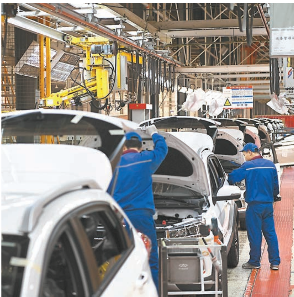
專家稱，製造業保持穩步增長態勢，非製造業擴張步伐有所加快，對經濟增長的拉動作用進一步增強。圖為奇瑞汽車鄂爾多斯分公司員工在生產線上工作。

香港文匯報訊（記者 海巖 北京報道）國家統計局昨日發佈的中國4月製造業採購經理指數（PMI）錄得51.4%，較3月微降0.1個百分點，但高於一季度均值0.4個百分點，並是一年來首次高於去年同期水平，亦從去年3季度以來的總體下降趨勢轉為企穩略升。專家表示，整體看中國經濟運行平穩，周期性向好態勢進一步顯現。但統計局調查顯示，四成企業反映勞動力成本高，超25%企業認為物流成本高，並感到生產經營成本壓力較大。