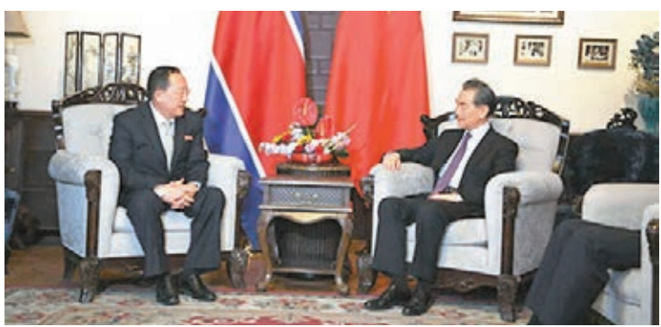
王毅（右）將應李勇浩邀請訪問朝鮮。圖為上月3日王毅會見正在北京過境的李勇浩。

姆努欽曾表示，他正考慮去中國就貿易問題進行談判，並對兩國未來達成協議解決爭端的可能性持「謹慎樂觀」態度。對此，美國媒體分析認為，如果姆努欽訪華並就美中貿易展開談判，將在相當程度上化解目前的中美經貿緊張局勢。