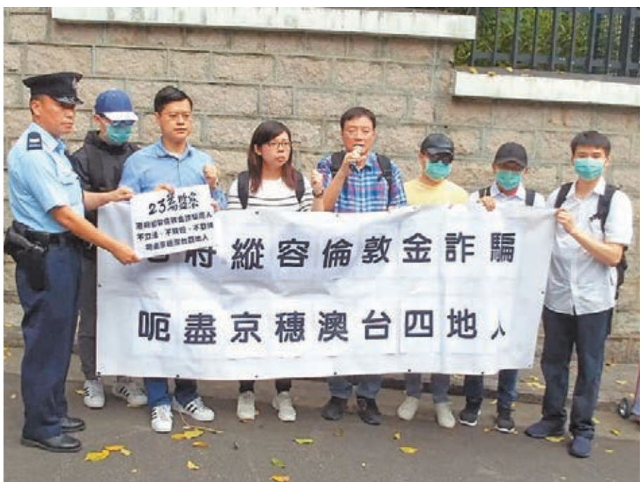
■「23萬監察」與數名被騙苦主往禮賓府外請願。

差,在一個社交軟件中認識了一名香港女孩,一個月內雙方已十分熟悉。然後對方帶他到一間公司開始炒倫敦金,結果以