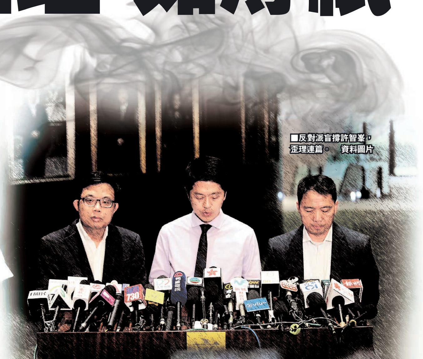
■反對派言撐許智峯，歪理連篇。資料圖片