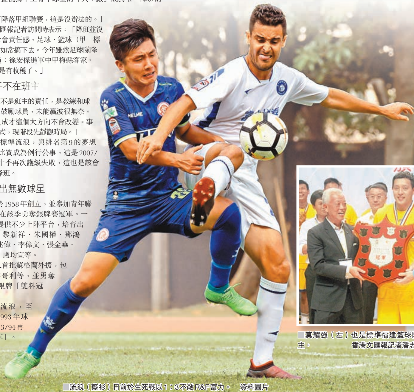
流浪(藍衫)日前於生死戰以1:3不敵R&F富力。資料圖片