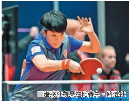
港將杜凱琹在比賽中。