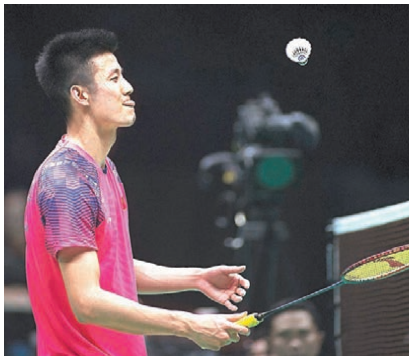
諶龍不敵桃田賢斗,亞羽賽衛冕失敗。

諶龍亞羽賽衛冕失敗。昨日在武漢閉幕的亞洲羽毛球錦標賽(亞羽賽),中國羽隊(國羽)收穫混雙、男雙兩枚金牌。其中在男子單打決賽,國羽里約奧運冠軍諶龍面對日本球手桃田賢斗,連輸兩局,以17:21及13:21不敵,未能蟬聯亞羽賽冠軍。