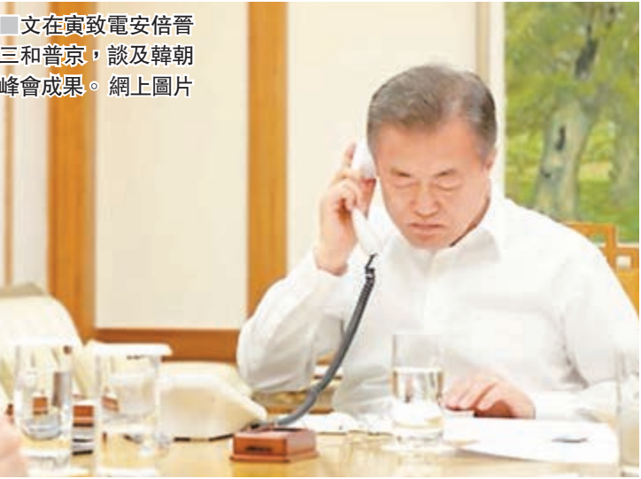
文在寅致電安倍晉三和普京，談及朝韓峰會成果。

文在寅在朝韓峰會中，向金正恩傳達安倍希望朝日外交關係正常化的意願，金正恩回覆時稱，願意隨時和日方會談。安倍感謝文在寅於朝韓峰會中，討論日本人遭綁架問題和朝日關係，又高度評價文在寅和金正恩落實全面無核化的決心，希望他們可付諸實行。韓國國家情報院院長徐薰昨日到日本會晤安倍，報告朝韓峰會成果。