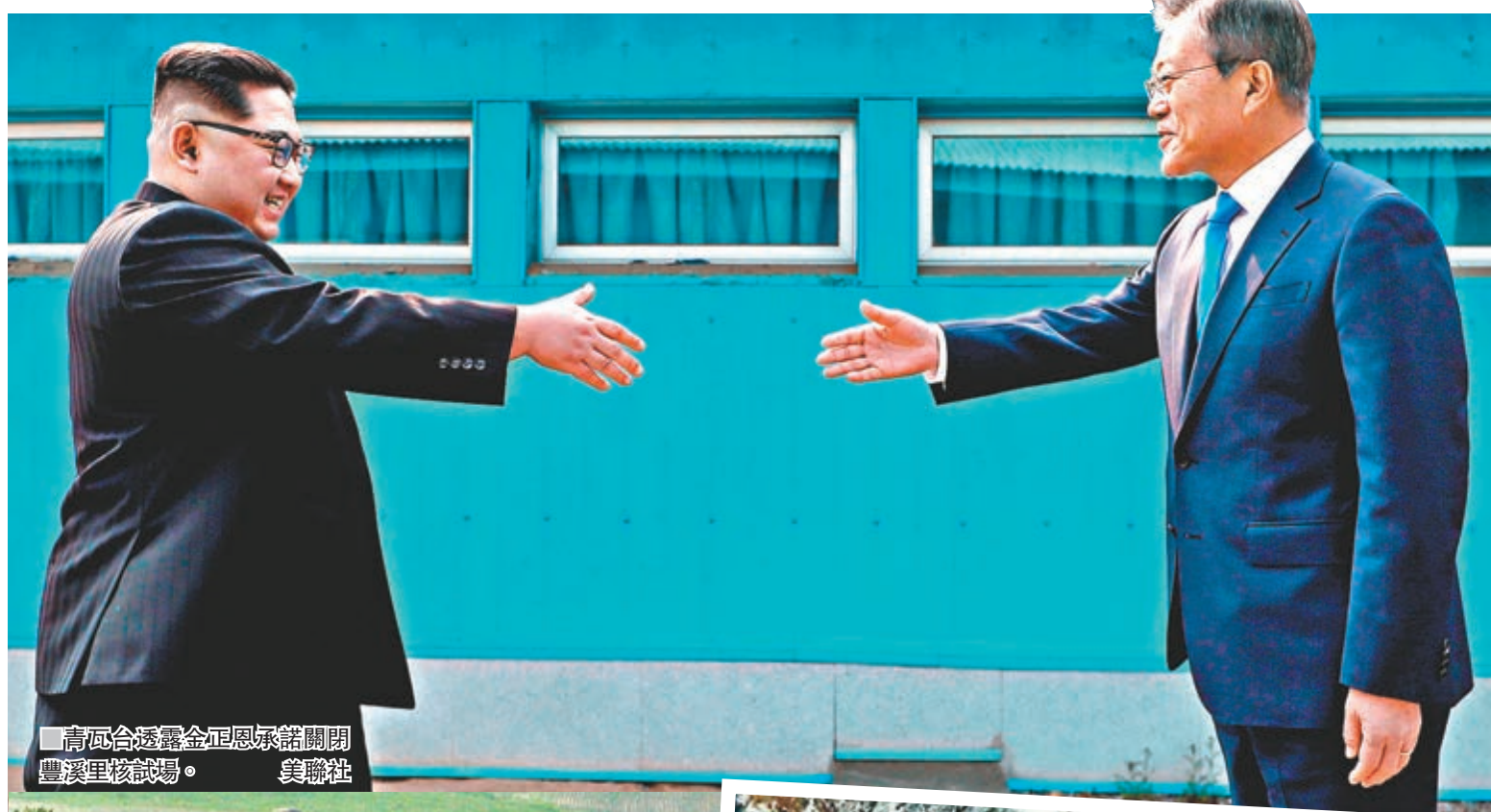
青瓦台透露金正恩承諾關閉豐溪里核試場。