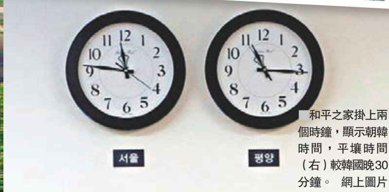
和平之家掛上兩個時鐘，顯示朝韓時間，平壤時間(右)較韓國晚30分鐘。網上圖片