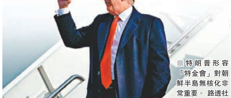
特朗普形容「特金會」對朝鮮半島無核化非常重要。

特朗普向文在寅表示，朝鮮未來的和平與繁榮，取決於其「完全、可驗證及不可逆轉的無核化」，朝韓通過簽署《板門店宣言》重申半島無核化目標，對全世界都是好消息，美韓同意保持緊密合作，致力促成美朝在首腦會談上，一致達成半島完全無核化的具體實施方案。特朗普其後在密歇根州出席集會，向支持者表示「特金會」非常重要，有助半島無核化及結束朝鮮戰爭，美國人應對現時漸入佳境的朝鮮局勢感到自