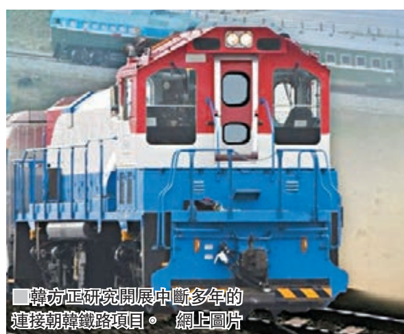
韓方正研究開展中斷多年的連接朝韓鐵路項目。網上圖片

朝最主要核試場 豐溪里曾6次核試 豐溪里核試場位於朝鮮東北部咸鏡北道吉州郡，被群山包圍，是朝鮮最主要的核試場地，相信亦是全球唯一活躍的核試場。朝鮮自2006年以來的6次核試，均是在豐溪里進行，最近一次為去年9月3日。豐溪里核試場位置隱蔽，外界只能依靠衛星圖片及追蹤該處設施移動情況，揣測其最新核子活動。美國一個分析朝鮮情報的網站上月指出，觀察到核試場隧道挖掘工程及其他運作明顯放緩，懷疑與朝鮮鋪路朝韓及美朝峰會有關。豐溪里鄰近中朝邊境，據報朝鮮去年9月核試時，中國部分邊境城鎮曾有震感。另有消息指核試場的隧道曾發生坍塌，以及在進行多次核試後已無法運作，但這些說法均無法證實。■法新社/新加坡《海峽時報》