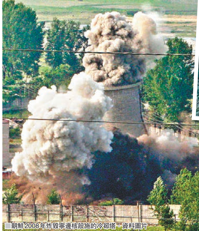
朝鮮2008年炸毀寧邊核設施的冷卻塔。