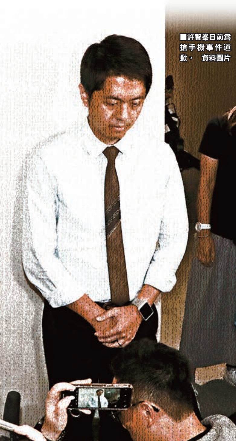
■許智峯日前為搶手機事件道歉。資料圖片