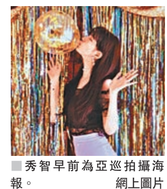
秀智早前為亞巡拍攝海報。

秀智，今年撻着男星李棟旭，更公開認戀，有愛情都可同時兼顧事業，秀智人氣依然強勁，工作浪接浪，她除將於下月3日舉行的韓國《第54屆百想藝術大賞》搭檔申東燁、朴寶劍合作做司儀外，更以55%的得票率獲得「人氣獎」女子部門一位，而憑《經常請吃飯的漂亮姐姐》爆紅的丁海寅則以37.5%的得票率獲得男子部門一位。據知，丁海寅亦將會出席「第54屆百想藝術大賞」，這也是秀智與丁海寅在拍畢劇集《當你沉睡時》後再相會，讓人期待。