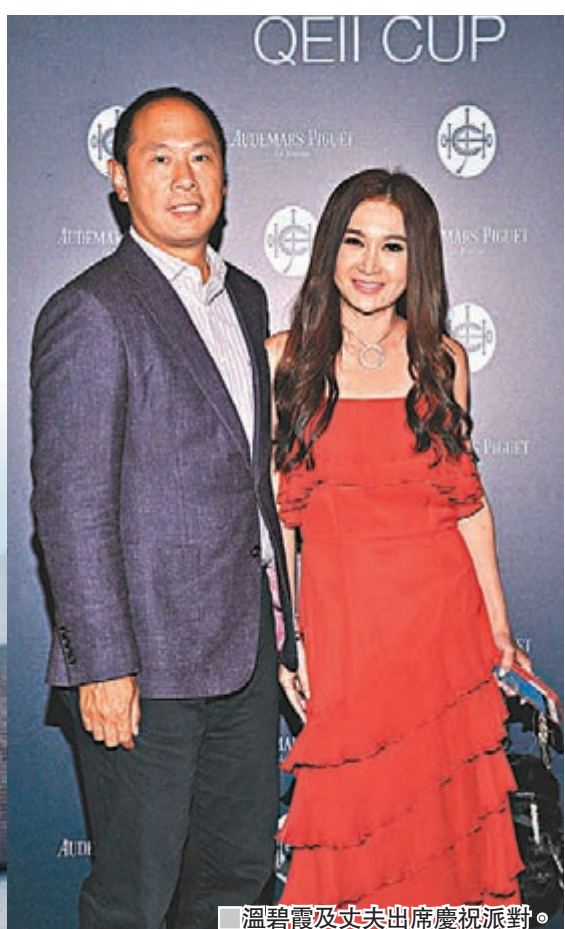
溫碧霞及丈夫出席慶祝派對。