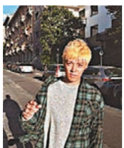
康男昨日在韓國遇車禍。

現年31歲的康男曾參與錄影綜藝節目《叢林的法則》而為港人熟悉，其說話風格談諧、個性灑脫，在綜藝節目上表現出色，人氣不俗。