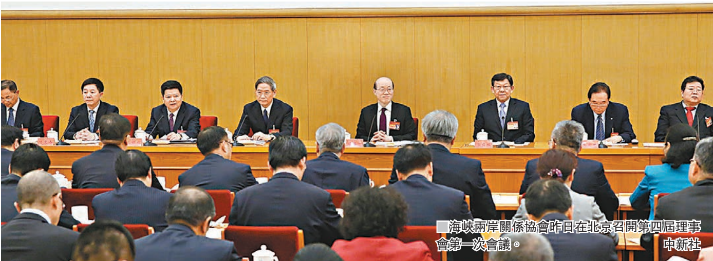
■海峽兩岸關係協會昨日在北京召開第四屆理事會第一次會議。

二共識」基礎上，舉行三次兩會領導人會談，簽署五項協議，解決了一批兩岸同胞迫切關心的經濟、社會、民生等問題。然而，2016年5月以後，民進黨當局拒不承認「九二共識」，破壞兩岸關係的政治基礎，致使兩會協商聯繫機制中斷。