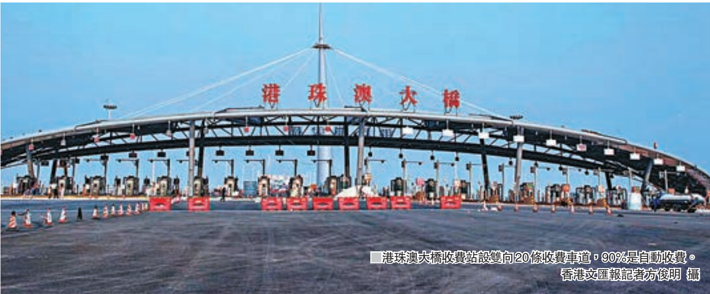
■港珠澳大橋收費站設雙向20條收費車道，90%是自動收費。

在粵澳方面，廣東聯合電子服務股份公司也與澳門通股份公司、廣發銀行澳門分行合作推出「先消費，後結算」的「e行卡、澳門通」聯名卡。此卡實現了粵澳兩地牌車用戶直接在澳門通公司或廣發銀行澳門分行申請辦理開卡，綁定扣款賬戶後以澳門幣進行結算，免除結匯和跨境辦理的繁瑣。