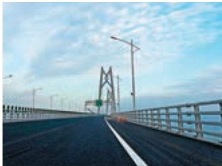
■收費系統聯調檢測工作順利完成，意味着港珠澳大橋通車時間越來越近。

支持納入全國ETC聯網標準的國標ETC卡用戶和安裝香港快易通電子標籤的用戶，安裝以上兩種電子標籤的車輛，今後均可快速通行大橋收費站ETC車道。有參與測試的司機坦言，以往從香港開車到珠海只能繞道走虎門大橋，而虎門大橋容易塞車，一趟下來要耗3個鐘乃至半天時間，現在經港珠澳大橋僅需半個鐘，「大橋帶來的這樣跨境便利是實實在在的」。 據了解，港珠澳大橋主線收費站為雙向20條收費車道，其中18條是電子不停車收費（ETC），僅保留兩條人工收費車道，是目前廣東省內ETC車道比例最高的收費站。從目前廣東使用ETC車道的情況來看，每條ETC車道每天最多可通過一萬輛車，而人工收費車道每天只能通過1,500至2,000輛車。