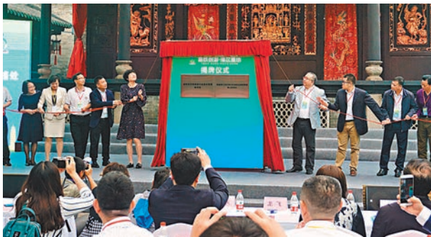
■會上，高鐵路經濟帶旅遊行業協會聯盟秘書處揭牌。