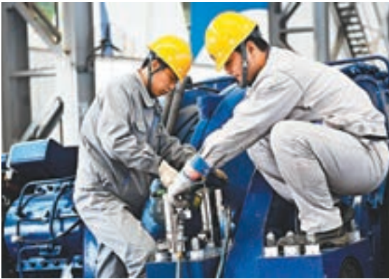
■利潤結構有所優化，企業效益持續改善，工業經濟穩中向好。圖為內蒙古非煤產業發展促進工業轉型升級，在內蒙古鄂爾多斯市久和能源裝備有限公司，工作人員正組裝風電機。 資料圖片

數據顯示，一季度，煤炭開採和洗選業利潤總額同比增長18.1%，石油和天然氣開採業增長1.2倍，黑色金屬冶煉和壓延加工業增長64.1%。但汽車製造業利潤同比下降4.7%，電氣機械和器材製造業下降0.7%，計算機、通信和其他電子設備製造業下降11%。