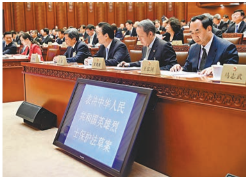
■十三屆全國人大常委會第二次會議昨閉幕。會議表決通過了英雄烈士保護法。

香港文匯報訊（記者 劉凝哲 北京報道）十三屆全國人大常委會第二次會議昨日全票表決通過英雄烈士保護法。這部法律將自5月1日開始實施。專家認為，法律宣示了國家和人民永遠銘記一切為中華民族和中國人民作出犧牲和貢獻的英雄烈士，表明捍衛英雄烈士鮮明的價值導向。此外，法律還在二審稿中寫入相關條款，嚴厲打擊「精日」分子。