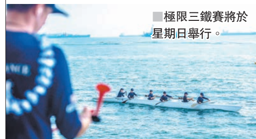
■極限三鐵賽將於星期日舉行。

Red Bull 3 Peaks極限三鐵賽將於星期日舉行。參賽隊伍包括5支來自Victoria Recreation Club及香港遊艇會的本地隊伍以及2支新加坡隊伍。這項以邊架艇獨木舟（outrigger canoe）為主的賽事，每支參賽隊伍共有6名成員，他們將會在香港遊艇會的熨波洲會所為起點，透過游泳、划獨木舟（24公里）及越野跑（12公里），最終在石澳後灘衝線。比賽是對各隊團隊合作、速度、戰術以及耐力的一大考驗。香港文匯報記者 陳曉莉