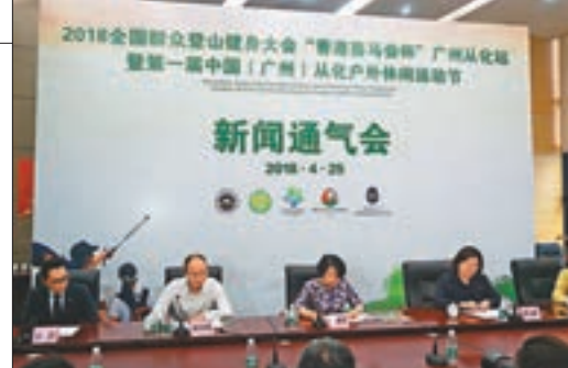
■全國群眾登山健身大會從化站下月舉行。

香港文匯報訊（記者 敬敏輝 廣州報導）2018全國群眾登山健身大會「香港賽馬會盃」廣州從化站，將於下月5日舉行。本屆登山大會，香港賽馬會首次贊助支持。主辦方表示，希望借助從化豐富的自然條件，打造立足廣州，輻射粵港澳大灣區的大型登山系列品牌，吸引更多三地居民共同參與。體驗組線路總長約6公里，地勢較為平緩。挑戰組線路總長約12公里，沿途有田野小道、茂密樹林及陡峭山坡，適合具備較強耐力與堅韌毅力的登山愛好者。