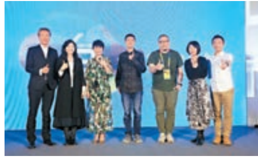
■台灣電影以Taiwan Cinema為品牌再次參展，今年推介會呈現三部精彩好片《引爆點》、《生生》及《美力台灣3D》。