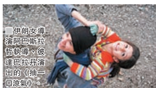
■伊朗女導演阿巴斯拉哲執導、彼達巴拉丹演出的《抽一口涼氣》。