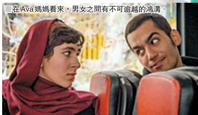
■在Ava媽媽看來，男女之間有不可逾越的鴻溝。