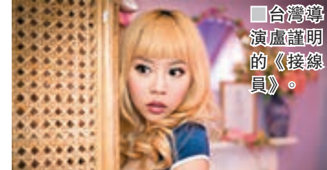
■台灣導演盧謹明的《接線員》。