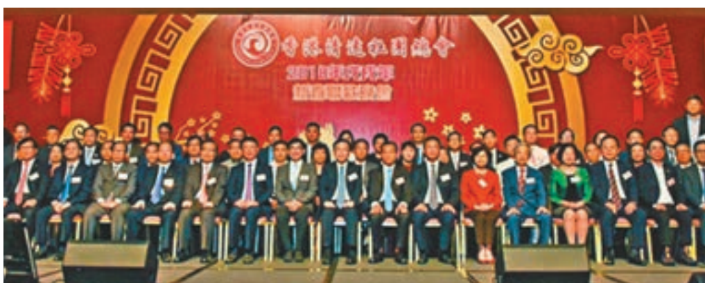
何靖主禮香港清遠社團總會新春聯歡晚會。

香港文匯報訊(記者 子京)據中聯辦網訊,中聯辦副主任何靖日前出席並主禮香港清遠社團總會新春聯歡晚會。全國人大常委譚耀宗,清遠市政協主席梁志強,清遠市委統戰部部長劉漢球,以及清遠市有關領導、清遠籍在港鄉親和香港各界友好人士,超過1,100名參加活動。