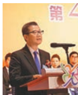
陳茂波為活動主禮並致辭。

全國政協常委余國春,中聯辦新界工作部副部長謝錦文、青年工作部副部長楊成偉,特區政府商務及經濟發展局副局長陳百里,福建省委統戰部副部長翁雄宇、副巡視員廖長桂,福