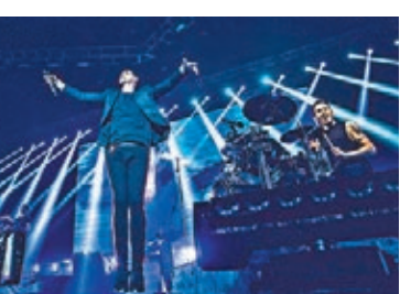
The Script唱了不少樂隊名曲，粉絲不時隨着一起唱。

亦就遲開騷一事致歉。後來在唱《No Man Is An Island》時，Danny叫觀眾用手搭住身旁的人肩膀，像二人三足般跟隨拍子「扮蟹」打橫行，非常有趣。為令台側的觀眾能睇得投入，三子及後突然行到舞台左側連唱兩首Acoustic作品，所有觀眾即時湧向左邊，到唱完後又有秩序地返回原位。臨安歌前的一曲《Rain》，Danny更走遍全場來唱，誇張到越過圍欄由前排走到後排，令觀眾們紛紛舉機撲過去影相。小休一會後，三子再次出場，適逢當天是客席鋼琴手Luke牛一，Danny引領台下觀眾一起唱生日歌，最後以樂隊名曲《Hall Of Fame》為演唱會劃上圓滿句號。