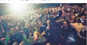
The Script前晚舉行港騷，主音Danny唱到興起即走落台和歌迷大玩Selfie。