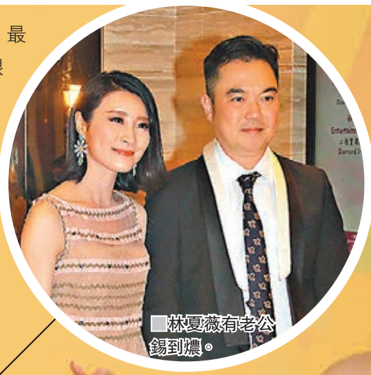
林夏薇有老公錫到燦。

採訪：植毅儀 髮型：Ivan Lee @ Headquarters/化妝：江中平化妝室