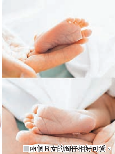
兩個B女的腳仔相好可愛。