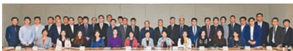
張建宗（後排中）與青年發展委員會委員合照。

張建宗指出，委員會的非官方委員具其代表性，包括社會領袖及與青年發展相關界別的專家和持份者，當中逾半數屬 35 歲或以下的青年委員，他們在會議上充分發揮其專業知識和經驗，及分享作為青年人的親身經