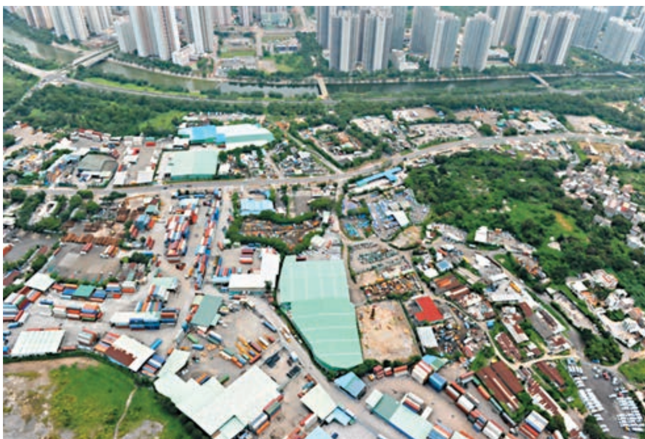
智經調查發現，市民對如何增加本港土地供應存分歧。圖為洪水橋「棕地」。

對於特首林鄭月娥去年發表施政報告時提出向中產家庭提供「港人首置上車盤」，他指逾 60% 受訪者期望政府參考現有居屋按揭做法，為購買「港人首置上車盤」家庭承造九成按揭，及提供按揭貸款保證。