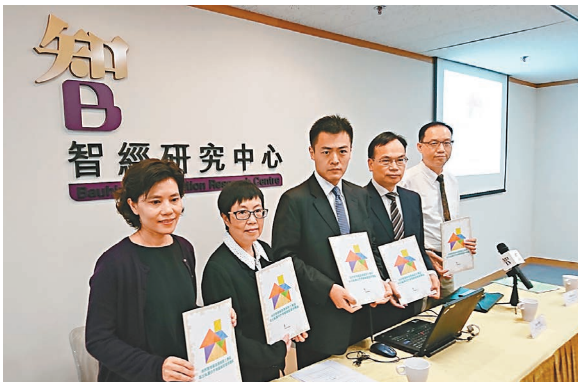
調查又發現，65%受訪者認同公私營合作可提供資助房屋。