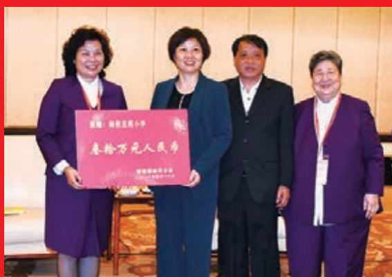
香港福建同鄉會向閩侯亞周小學捐資30萬元