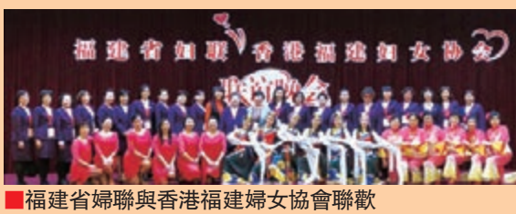
福建省婦聯與香港福建婦女協會聯歡