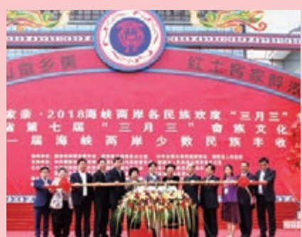
陳聰聰出席福建省第七屆「三月三」畬族文化節開幕式

「三月三」是上杭畬族具有代表性的傳統節日，寄託着畬族人民對美好生活的無限嚮往。每年在這一節日裡都要舉行盛大歌會，並祭祖先拜谷神，載歌載舞，熱鬧非凡。畬族傳統文化歷史悠久，民族特點鮮明，山歌、舞蹈、婚嫁、祭祀等風情習俗、古樸深奧，富有情趣，鄉俚民俗，純樸熱情。