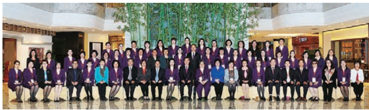
福建省委常委、福州市委書記王寧等會見訪問團一行，賓主合照。

福建省委書記于偉國，省委常委、福州市委書記王寧，省委常委、統戰部部長雷春美，省委常委、省委秘書長梁建勇，省人大常委會副主任兼省婦聯主席吳洪芹，省僑聯主席陳式海，省僑辦副主任劉良輝等會見了訪問團一行並座談交流。