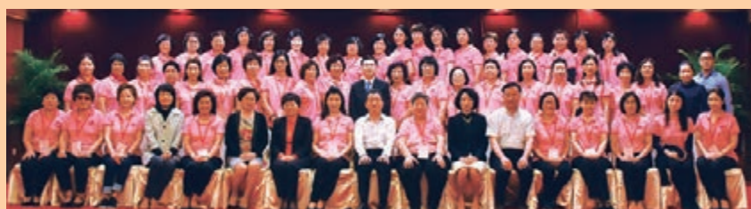
福建省僑聯主席陳式海等會見訪問團一行，賓主合照。

訪問團與福建省婦聯舉行了聯歡晚會，大家歡聚一堂，載歌載舞，心手相連，譜寫友誼。婦女協會姐妹們獻上的精彩節目，贏得陣陣掌聲，舞蹈隊帶來的舞蹈《共築中國夢》更是將晚會推向高潮，大家共同祝願閩港合作共融，共同祝願偉大的祖國繁榮昌盛。