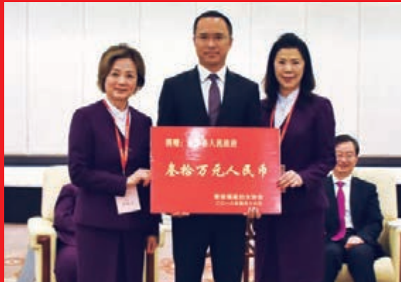
香港福建婦女協會向永泰縣政府捐資30萬元

訪問團一行看到家鄉福州發展的新變化，深感自豪、深受鼓舞，紛紛表示將大力弘揚愛國愛港愛鄉的光榮傳統，發揮好橋樑紐帶作用，積極支持福州發展。香港福建婦女協會、香港福建同鄉會分別向永泰縣政府、閩侯亞周小學捐資30萬元，助力當地民生事業建設。