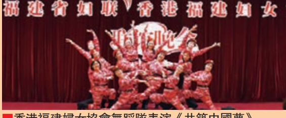
香港福建婦女協會舞蹈隊表演《共築中國夢》