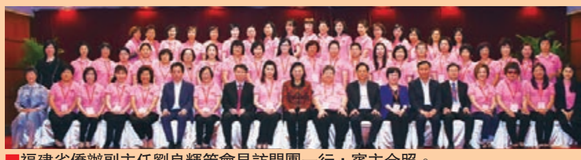
福建省僑辦副主任劉良輝等會見訪問團一行，賓主合照。