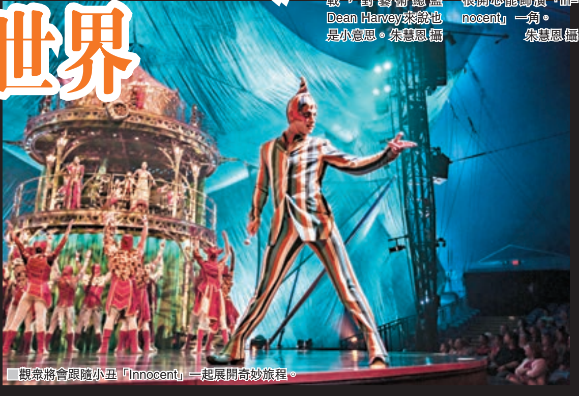
觀眾將會跟隨小丑「Innocent」一起展開奇妙旅程。

「KOOZA」一詞源於梵語「koza」，原來是「箱子」、「大木箱」或「珍寶」的意思。最近，這個「箱子」悄悄降臨到中環。不如我們一起走進這個神秘的「箱子」，一窺究竟？