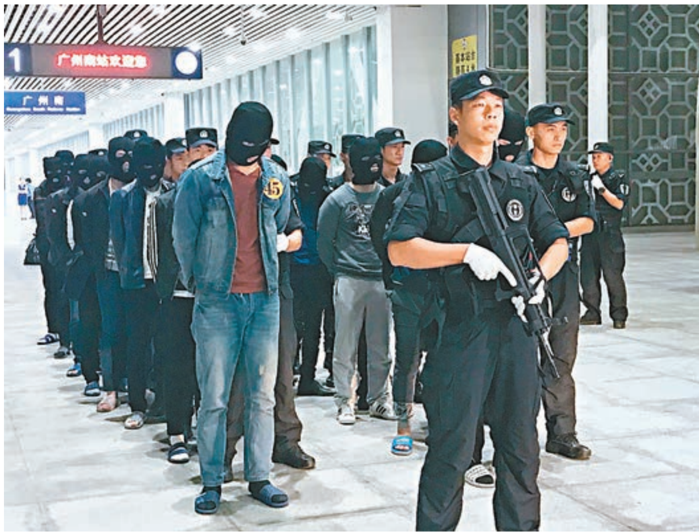
會議要求繼續深入推進打擊電信網絡詐騙犯罪專項行動。圖為廣東警方日前抓獲電信詐騙疑犯。

香港文匯報訊 綜合中新社及海外網報道，跨區域流竄作案、電信詐騙、黑惡勢力等犯罪形態，成為當前擾亂社會治安、侵犯民眾財產的突出問題。中國公安機關打擊刑事犯罪工作推進會18日至19日在深圳市召開，國務委員、公安部部長趙克志指出，針對當前侵財犯罪跨區域和智能化特點，重點打擊跨區域流竄犯罪、職業犯罪，深入整治犯罪輸出重點地區。趙克志又指出，各級公安機關要加快構建全國整體打擊犯罪大格局，通過強化案件受理和勘查工作、強力推進相關平台和系統的建設與應用，不斷提升打擊犯罪的能力和水平。