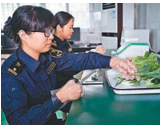
原深圳出入境檢驗檢疫局昨日起統一以深圳海關名義對外開展工作。圖為關員檢測供港蔬菜。

據深圳海關介紹，自4月20日起，深圳各口岸的關檢旅檢監管、通關作業申報查驗放行「三個一」、運輸工具登臨檢查、輻射探測、郵件監管、快件監管、報關報檢企業資質註冊以及對外「一個窗口」辦理等7個業務領域完成優化整合，實現「一口對外、一次辦理」。