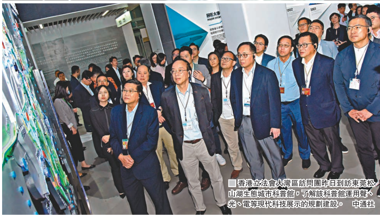
香港立法會大灣區訪問團昨日到訪東莞松山湖生態城市科普館，了解該科普館運用聲、光、電等現代科技展示的規劃建設。