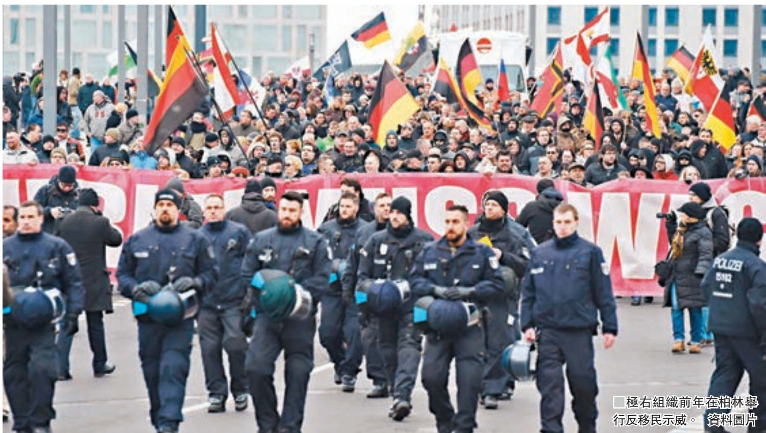
極右組織前年在柏林舉行反移民示威。