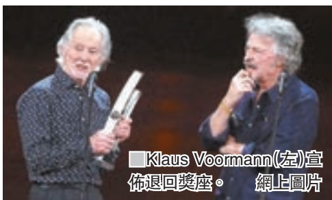
Klaus Voormann(左)宣佈退回獎座。

Awards上週舉行，最佳Hip-Hop專輯由組合Kollegah和Farid Bang的《Jung, Brutal, Gutausschend 3》奪得，由於大碟內部分歌詞涉及反猶，引起譁然，終身成就獎得主Klaus Voormann等多名得獎人更宣佈退回獎座抗議。