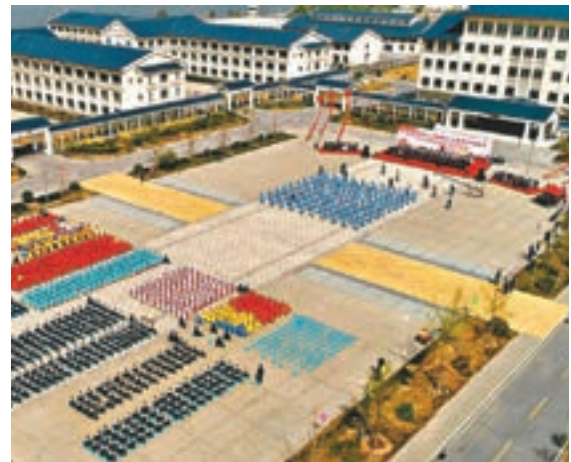
■天津長泰監獄鳥瞰圖。受訪者供圖