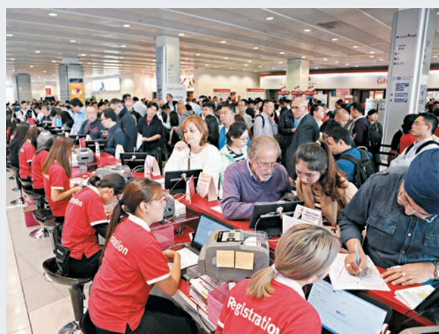
今屆「環球資源移動電子展」與2014年首屆相比,展位數目增長逾80%。