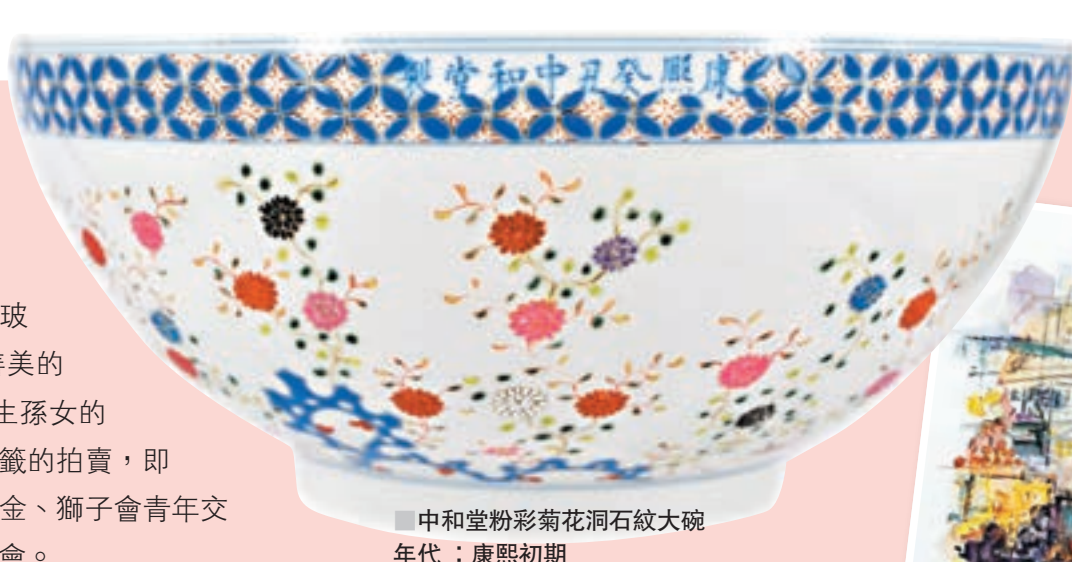
中和堂粉彩菊花洞石紋大碗 年代：康熙初期 邊款：康熙癸丑中和堂製 尺寸：H11.5cm x D27cm x B12.75cm 市場估價：HK$3,800,000 - HK$5,000,000

除何氏舊藏，書畫部分的拍件選擇，難得一見地呈現出本港拍賣的「廣東特色」。文：香港文匯報記者 張夢薇 資料提供：寶晉達國際拍賣行