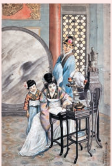
關蕙農《仕女圖2》 市場估價：HK$480,000

在人物形象刻畫上，臉部、肌膚及衣紋，達到柔美、豐腴與亂真的效果，並具有「甜、糯、嗲、嫩」之特色，開了廣告畫之先河，成為商業廣告畫法的主流，深受大眾喜愛，被公認為香港的「月份牌大王」。