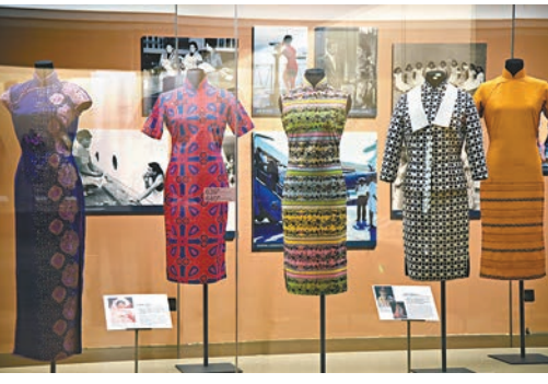
不同年代的香港長衫在廣東省博物館展出。