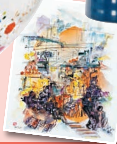
楊紫霞《Fruit Stalls》 市場估價：HK$350,000 - HK$450,000