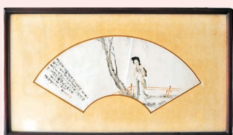
黃少梅《美人圖扇面》 年代：清至民國 尺寸：全幅原裱加硬卡 68cm x 38cm 市場估價：HK$500,000 - HK$800,000

黃少梅(1886-1940)，字阿彌，號寒香，廣東東莞人，以仕女畫聞名於時。1923年黃少梅與黃君璧、鄧芬、黃般若等十四人成立「癸亥合作社」研發書畫藝術，就是廣東國畫研究會的前身，研究會到1937年解散，前後15年，參加畫家二百多位知名畫家，對廣東畫壇影響深遠，黃少梅是關鍵人物。 黃少梅病逝香港，年五十五，她畫仕女非常傳神，更注重環境的渲染與意境的刻畫，而畫山水多為水墨意筆。畫風傳統，以宋元的繪畫為宗，作品中古意盎然。仿古而不泥古，弘揚傳統而不守舊。此仕女扇面就是他的代表作。 其最為人稱道者，為於1912年與潘達微扮扮成乞丐，到佛山行乞三天，體驗生活，其姪黃般若也隨行。三人換上一身破爛，以爐灰塗臉，加入行乞隊伍，殘羹剩飯。歸來後，潘達微與黃少梅以途中見聞作《流民圖》，轟動整個廣東美術界。潘達微是居廉的入室弟子，和高劍父、陳樹人是師兄弟，也是後來收殮黃花崗烈士遺骸的人。