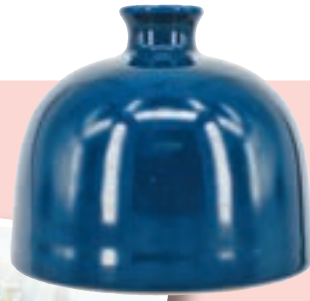
祭藍釉太白尊 年代：清光緒(1875-1907) 尺寸：H12cm x B13.5cm 市場估價：HK$300,000 - HK$500,000