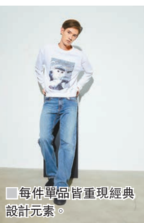
■每件單品皆重現經典設計元素。

它的同名品牌自2008年宣佈擱置後，今次透過與GU的聯乘企劃再次登場，其聯乘系列共推出55件男女裝單品，除了上衣及下身單品外，亦有各項配飾如棒球帽、襪及內衣等。每項單品均重現當年的經典設計意念及元素，並加入雙碼標籤作記認，分別為Kim Jones同名品牌的原本設計產品標碼，以及今個系列的產品標碼。