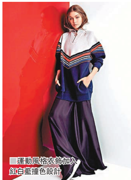
■運動風格衣飾加入紅白藍撞色設計

運動風格衣飾加入紅白藍的撞色設計，並以標誌性Gigi賽車彩帶飾條、圖形徽章和刺繡速度標誌綴飾。而金色拉鍊細節、對比鮮明的縫線和滾邊為衣飾增添奢華氣派。混搭的剪裁、超大碼與極貼身設計，打造出堅定自信的賽車造型新風。