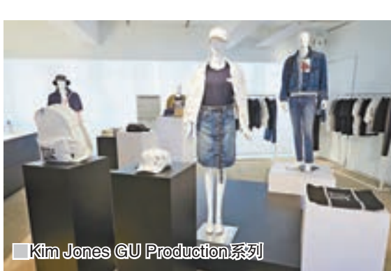
■Kim Jones GU Production系列