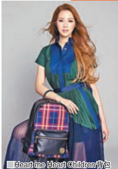
■Heart me Heart Children背包

這背包系列共有4款設計，採用優質意大利羊皮製作，品牌設計用心注重細節，柔軟貼身的肩帶讓人更感舒適。中性簡約設計，同時空間感十足，包括前方加入拉鍊間格及兩側插袋，既實用又時尚。