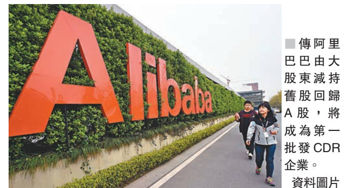
傳阿里巴巴由大股東減持舊股回歸A股,將成為第一批發CDR企業。 資料圖片

榜單在大中華範圍內收錄共計151家獨角獸企業,其中新晉獨角獸企業33家,因完成IPO退出榜單的企業2家,整體估值總計超4萬億元。來自於互聯網服務行業的獨角獸企業數量最多,共有38家上榜,佔總數的26%。北京合計有66家企業上榜,佔總數的45%;上海和杭州分列二、三位,獨角獸企業數量分別達到38家和16家,深圳以11家位列第四。