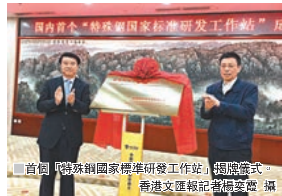
首個「特殊鋼國家標準研發工作站」揭牌儀式。

牌成立。集團旗下西王特鋼與冶金工業信息標準研究院簽署戰略合作協議,雙方將通過工作站進行標準立項研發,開展鐵路鋼軌及附件等高端製造用鋼新材料國際標準研發和主持制訂工作,全面推進高端裝備材料國產化和標準國際化進程。