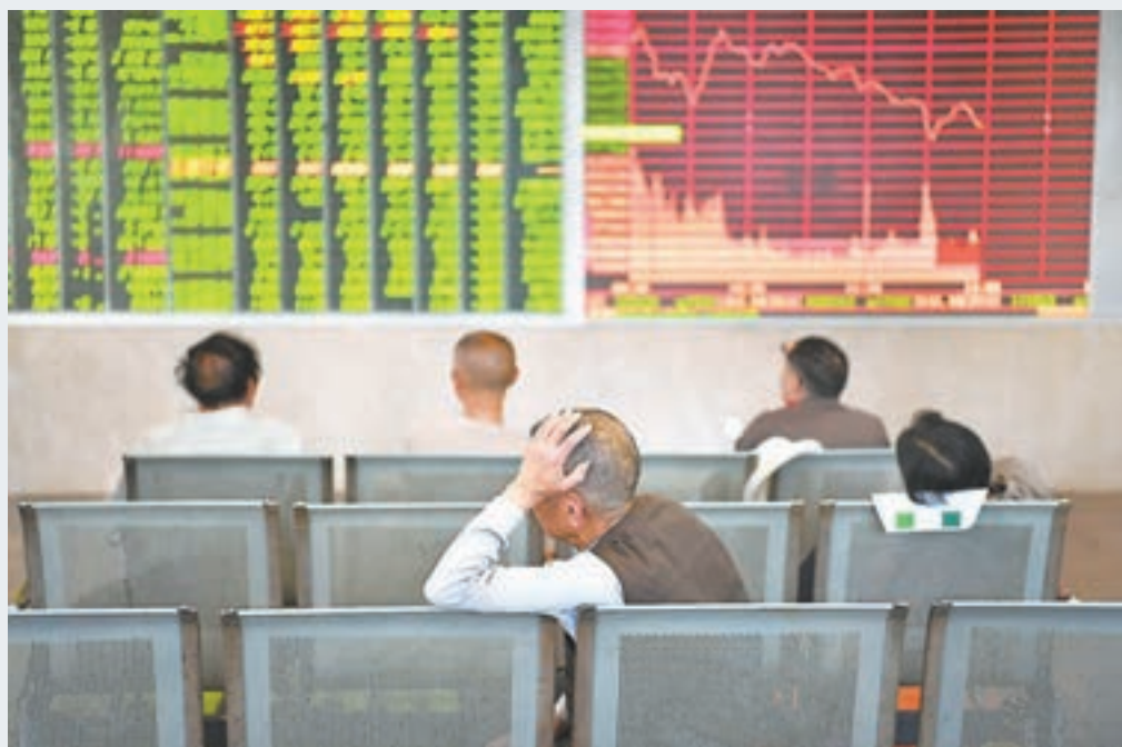
A股昨日全線下挫,滬綜指10個月來首次失守3,100關。

香港文匯報訊(記者章蕪蘭上海報道)中美貿易摩擦再升級,且市傳海南板塊暴炒已被監管部門關注,導致投資者做多信心急挫;加上昨天公佈的宏觀經濟數據中,工業及投資放緩。滬深A股均受壓下行,滬綜指跌1.41%,收報3,066點,不但日線四連陰,更是10個月來首次收於3,100點以下;深成指跌幅超過2%,創業板指暴跌近3%。