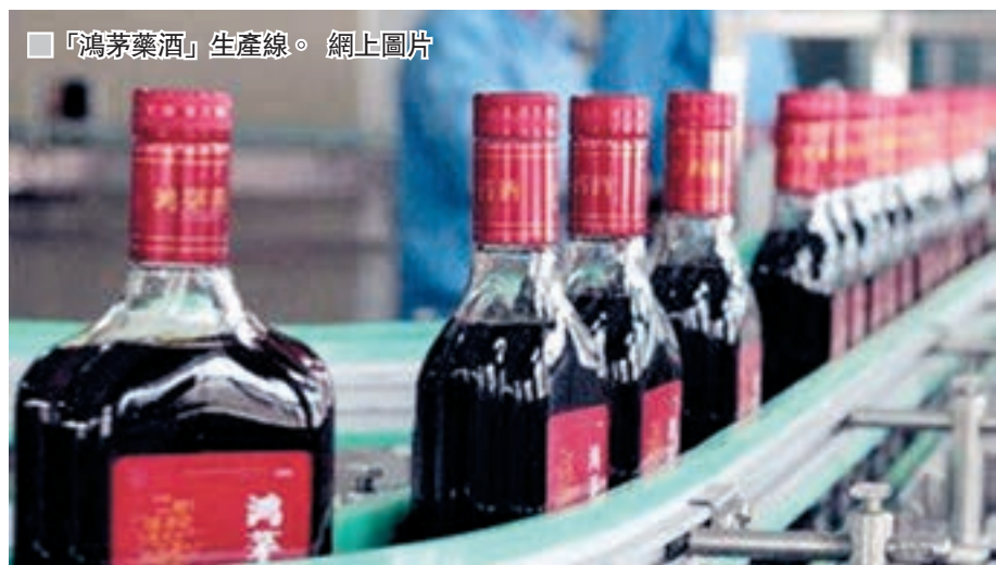
「鴻茅藥酒」生產線。