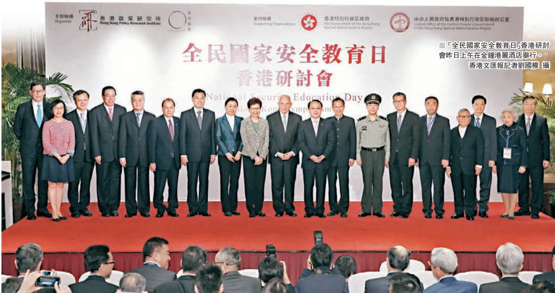
「全民國家安全教育日」香港研討會昨日上午在金鐘港麗酒店舉行。