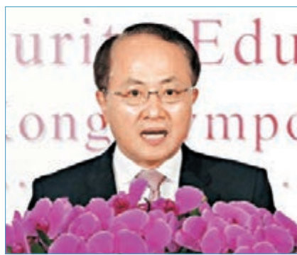
中聯辦主任王志民昨日出席「全民國家安全教育日」香港研討會並致辭。