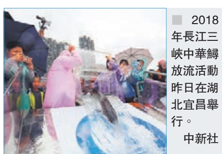
2018年長江三峽中華鱘放流活動昨日在湖北宜昌舉行。

中華鱘是國家一級重點保護野生動物，被譽為「水中大熊貓」，作為長江中的旗艦物種，具有生態風向標的作用。受生態