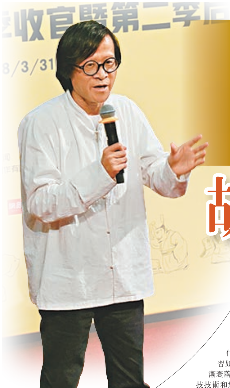
胡野秋以微視頻呈現歷史的價值和意義。

內地知名作家、編劇、導演胡野秋，在網絡平台以《胡腔野調》的微視頻講述了一個又一個在日常看似簡單、通俗但卻蘊含不少深刻知識和背景的歷史故事。讓歷史的呈現變得更加多元，成為了《胡腔野調》這一歷史節目的一大特徵，也讓觀眾對歷史的學習、認知和領悟有了更加豐富的把握。