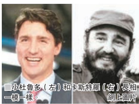
小杜魯多(左)和卡斯特羅(右)長相一模一樣。