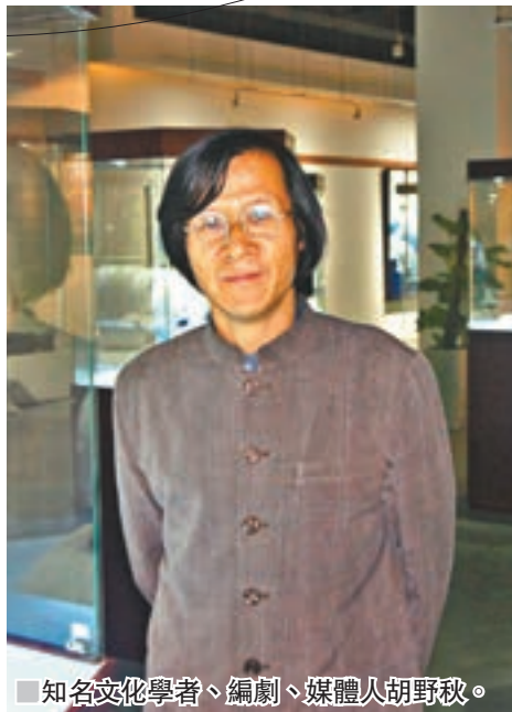
知名文化學者、編劇、媒體人胡野秋。

胡野秋說，《胡腔野調》是一種歷史呈現的創新，但他更希望大眾能夠明白，在這種創新的背後，其實是一種傳統的書寫和堅持。