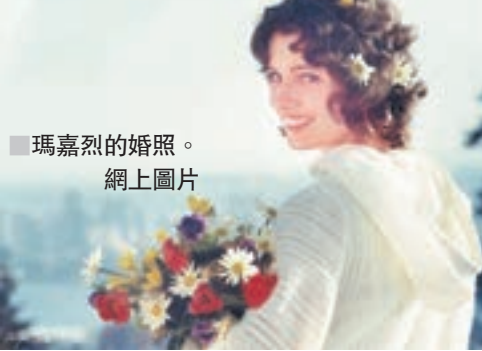
瑪嘉烈的婚禮。網上圖片

各異。1977年瑪嘉烈為了追求「自由」，離開丈夫，兩年後老杜的政黨在下議院失掉大部分議席，當晚瑪嘉烈在紐約一夜總會大跳狂舞——她的照片刊登於加拿大大眾報紙頭版。到1984年兩人正式離婚，老杜獲得三子撫養權，無須支付瑪嘉烈贍養費。