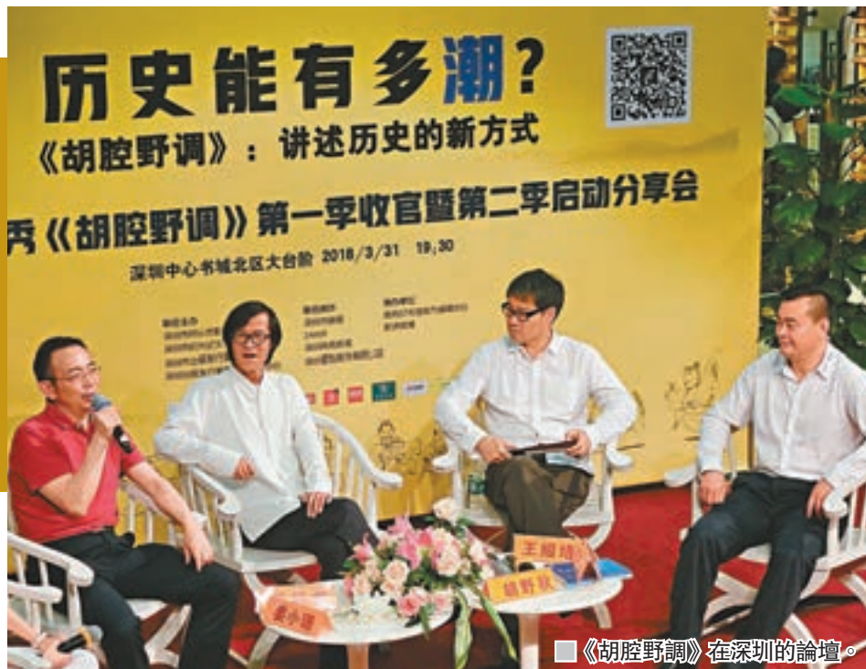
《胡腔野調》在深圳的論壇。