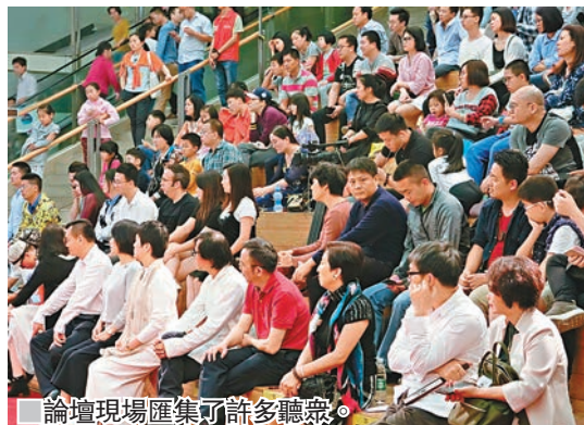
論壇現場匯集了許多聽眾。