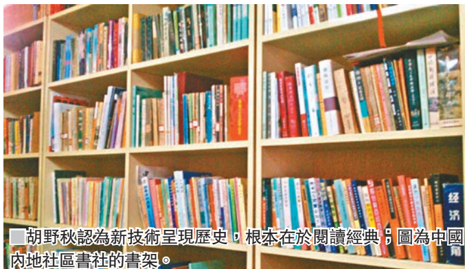
胡野秋認為新技術呈現歷史，根本在於閱讀經典。圖為中國內地社區書社的書架。