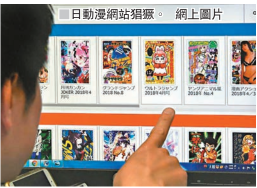
■日動漫網站猖獗。網上圖片