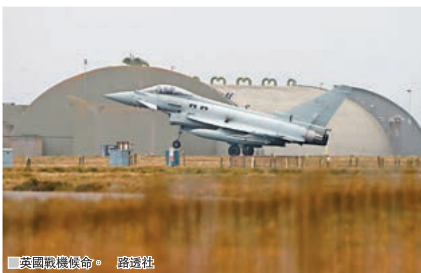
■英國戰機候命。

美國防長馬蒂斯警告，若對敘決策出錯，可能導致美國與俄羅斯及伊朗的衝突擴大，促請美國及盟國發動空