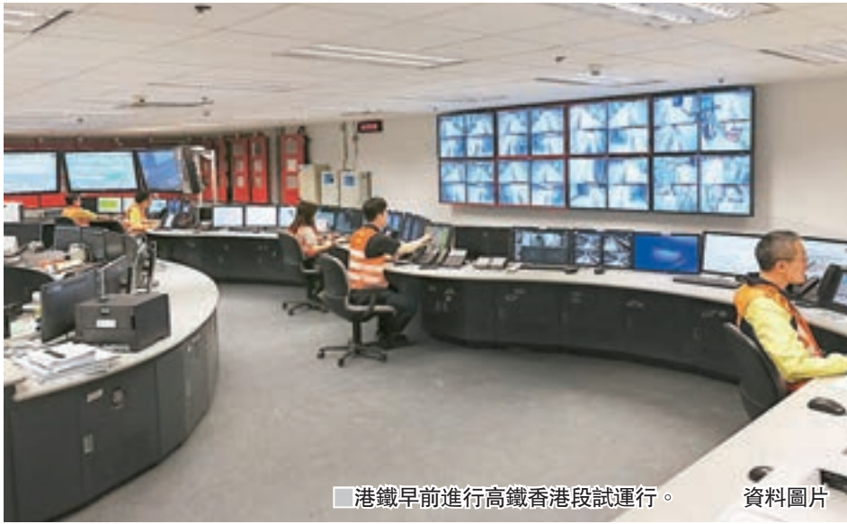
港鐵早前進行高鐵路試運行。資料圖片

港鐵又確定高鐵路香港段的所有路軌及車庫內其他維修軌道的結構裝置，均符合相關設計準則和安全規定而建造；車廠內其餘3條維修軌道走線均為直線，沒有彎位，經詳細檢查後亦確認全部狀態良好。正線路軌均牢固安裝在混凝土基座或軌枕上，亦無採用「工字鐵」及其結構裝置。