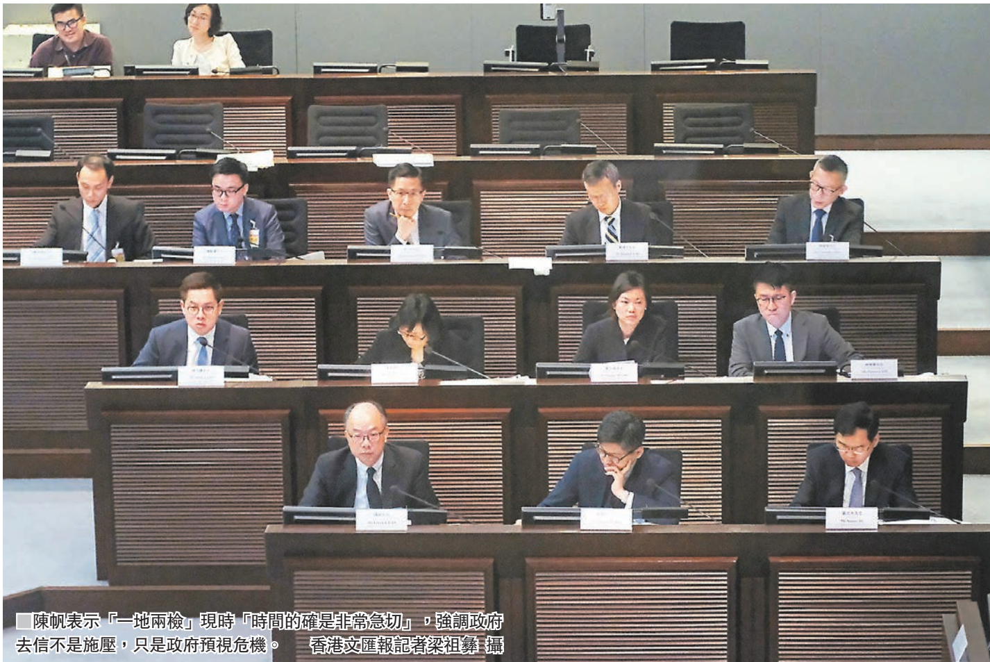
陳帆表示「一地兩檢」現時「時間的確是非常急切」，強調政府去信不是施壓，只是政府預視危機。

他表示，特區政府尊重不同意見，但法案是否合憲、合法，大眾都需要作出一個判斷，他不想評論對方的看法，但強調政府團隊的看法很清楚，「是合憲亦不違反基本法。」