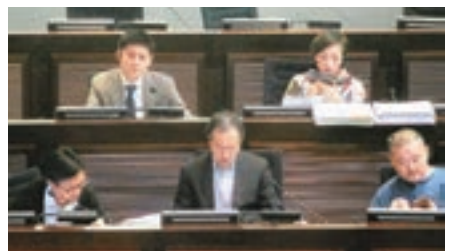
反對派議員昨日就劃線問題不斷發問，被建制派議員批評「無咩新意」。