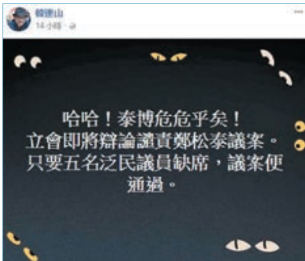
韓連山陰險濕濕叫其他反對派缺席。