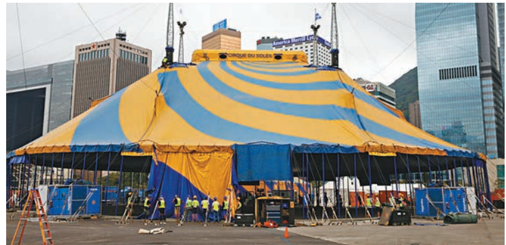
▲太陽馬戲將於本月19日在中環海濱開幕,大會昨進行主帳篷升頂儀式,為搭建馬戲團營地作好準備。

香港文匯報訊(記者 尹妮)太陽馬戲KOOZA巡迴香港站將於本月19日假中環海濱舉行首日表演,大會於昨日舉行主帳篷升頂儀式,由60名技術人員組成的團隊在地面豎立起逾百枝金屬柱,為搭建馬戲團營地作好準備。