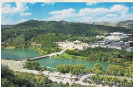
天下第一陵——軒轅黃帝陵。

者，陝西帝王陵，大體上分地上和地宮兩大部分。由於西周至春秋早期帝王陵「不封不樹」，因而周天子墓很難找到。而到了秦國，隨着國力逐漸強大，國君的墓葬形制已經由兩個墓道的「中」字形，變成了四個墓道的「亞」字形大墓，這在當時是僭越墓葬制度的行為。到了秦昭襄王時，陵寢建築開始出現在封土周圍。到秦始皇時，更出現空前絕後的巨大封土陵丘，設計高度達50丈，至今殘高仍有70餘米。