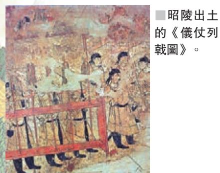
昭陵出土的《儀仗列戟圖》。

陪葬品則更豐富多彩，除了600多處陪葬坑與陪葬墓、「世界第八大奇蹟」的兵馬俑、「青銅之冠」銅車馬，以及石鎧甲、百戲俑、青銅水禽等高質量文物，其緊閉的地宮中所藏的珍品更是難以想像。此外，漢景帝陽陵已經出土了眾多的陪葬品及形象精美的「東方維納斯」陶俑群，漢武帝茂陵陪葬坑出土的文物更為精美，有鑲金銅馬、青銅犀尊和四神玉鋪首等。