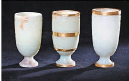
漢杜陵出土的玉杯。