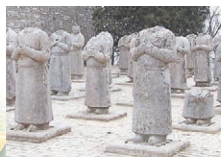
乾陵神道區陪葬的六十一番臣像。