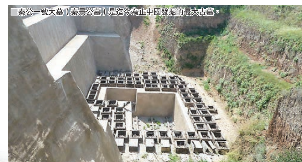
秦一號大墓(秦皇公墓)是迄今為止中國發掘的最大古墓。

縱觀在陝西建都的朝代，多是中國古代的盛世時期，又是厚葬盛行的時代，尤其是西周、秦、西漢、唐，均盛行厚葬制度，因而隨葬品極為豐富，玉器、金銀器、銅器等精美的隨葬品應有盡有。雍城的秦一號大墓歷史上儘管有200多次的盜掘，但卻仍然發現了3,500多件文物。秦始皇陵的