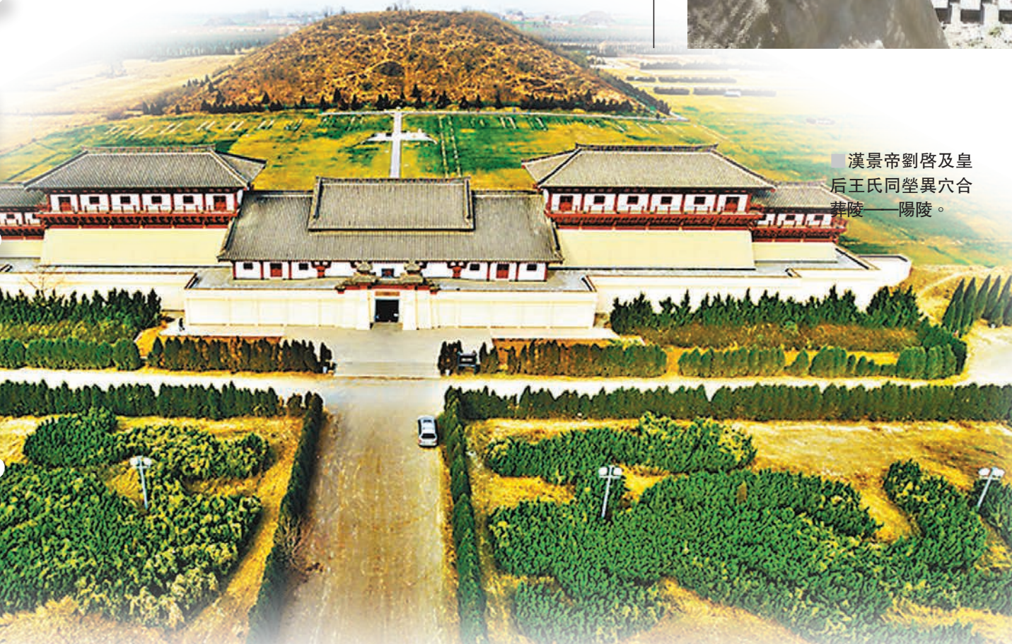
漢景帝劉啓及皇后王氏同塋異穴合葬陵——陽陵。

俗語有云：江南的才子北方的將，陝西的黃土埋皇上。作為華夏文明的發源地之一，先後有14個王朝在陝西建都，周、秦、漢、隋、唐都在這裡創造了輝煌的地上地下文化，而按照「陵隨都移」、「事死如生」的喪葬禮儀，帝王們往往會以自己生前的宏偉宮殿和都城為示範，在國都附近修建豪華的陵墓和地宮，同時陪葬大量的奇珍異寶。於是經過幾千年的歷史積累，陝西關中平原上便星星點點佈滿了各式各樣的帝王陵，成為一道獨一無二的壯麗奇觀。文：香港文匯報記者 李陽波