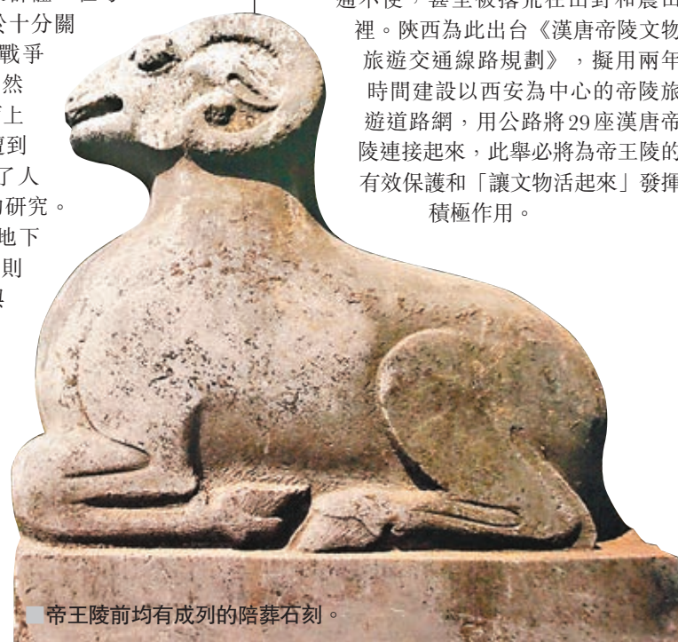
帝王陵前均有成列的陪葬石刻。

據悉，目前陝西的29座漢唐帝陵，正式對外開放的只有6座，不少帝陵由於交通不便，甚至被擱荒在山野和農田裡。陝西為此出台《漢唐帝陵文物旅遊交通線路規劃》，擬用兩年時間建設以西安為中心的帝陵旅遊道路網，用公路將29座漢唐帝陵連接起來，此舉必將為帝王陵的有效保護和「讓文物活起來」發揮積極作用。