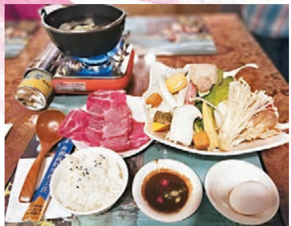
不少餐廳為迎合獨身族，推出一人餐。 資料圖片