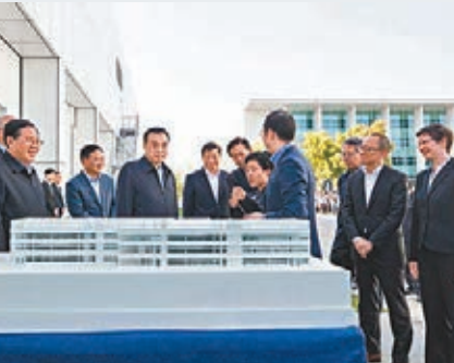
李克強面前的白色建築模型是羅氏創新研發中心。