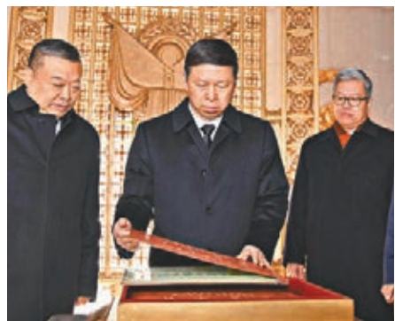
中共中央對外聯絡部部長宋濤（中）率團明赴朝參加藝術節。圖為宋濤去年以習近平特使身份訪朝鮮時在友誼塔內翻閱志願軍烈士名冊。

易先良在參加博鰲亞洲論壇2018年年會「南海分論壇」閉門會發表主旨演講時介紹，當前，在中國和東盟國家的共同努力下，南海局勢保持總體穩定，呈現出積極發展態勢，各方回到對話協商解決有關爭議問題的正軌。中國和東盟國家就「南海行為準則」框架已達成一致，正式進入「準則」案文磋商階段。