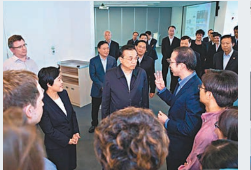
李克強十分關心抗癌藥品的價格，盼藥價優惠公道，讓患者能及時治療。