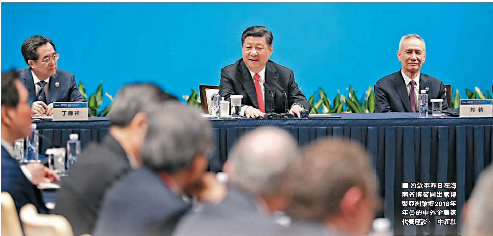
■ 習近平昨日在海南省博鰲同出席博鰲亞洲論壇2018年年會的中外企業家代表座談。

博鰲亞洲論壇現任理事長福田康夫、候任理事長潘基文、現任理事巴基斯坦前總理阿齊茲、法國前總理拉法蘭、候任理事菲律賓前總統阿羅約、意大利前總理普羅迪先後發言。他們表示，習近平主席昨天在年會開幕式上的主旨演講明確描繪了中國的發展方向，宣示了重大開放措施，充滿了改革精神，非常精彩、令人欽佩和感動。在全球化和多邊主義面臨挑戰之際，演講意義深遠，為世界經濟發展注入新的強勁活力，為人們指明了世界應何去何從的正確方向，是在重要的時刻提供了正確的答案，即中國致力於走中國特色社會主義道路，致力於改革開放，致力於可持續發展、高質量發展、創新發展，使人對中國的更大成功充滿信心。中國的成功將產生深遠影響，將為亞洲和世界帶來繁榮，也為世界其他國家提供了榜樣。中國已是全球經濟重要引擎，在應對氣候變化等國際事務中發揮了重要的建設性作用。國際社會各方應當像中國一樣，走改革開放、創新發展之路，不能走封閉僵化、保護主義和單邊主義的回頭路，共同建設亞洲命運共同體和人類命運共同體。論壇願為此作出自己的努力。