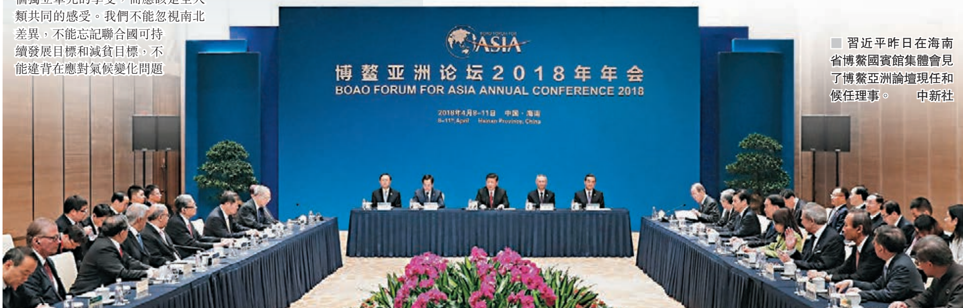
■ 習近平昨日在海南省博鰲國際會館集體會見了博鰲亞洲論壇現任和候任理事。

國際貨幣基金組織總裁拉加德高度讚賞習近平主席發表的主旨演講，特別是中國將堅定推進改革開放的積極信息。她說，演講為當今世界增加了確定性和希望。世界需要像中國這樣的領導力量。