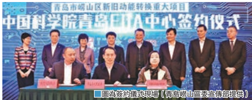
圖為簽約儀式現場

香港文匯報訊(記者楊奕霞山東報道)中科院青島EDA(電子設計自動化)中心近日正式簽約。嶗山區、中科院微電子所、曙光信息產業股份有限公司(簡稱中科曙光)三方將共同合作,建設共性技術服務支撐、資源集聚、創業者培育、專業人才培養的國際一流平台,帶動青島地區微電子及相關產業快速發展。