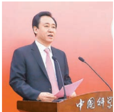
許家印指，佈局高科技產業是恒大塑造百年老店的重大戰略決策。

十九大報告強調，要積極推進科技強國建設，此次恒大與中科院聯手，對建設世界科技強國具有重要意義。早在今年3月26日，許家印在2017年全年業績發佈會上曾表示，恒大將積極探索高科技產業，逐步形成以民生地產為基礎、文化旅遊和健康養生為兩翼，以及高科技為龍頭的產業格局。此次與中科院正式牽手，顯示恒大佈局高科技產業邁出一大步。