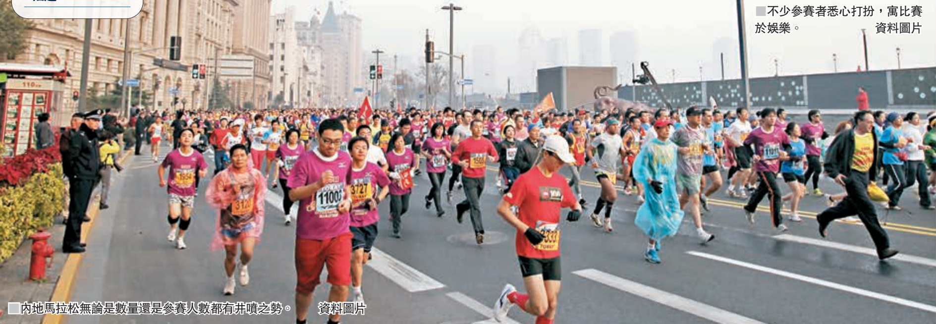
內地馬拉松無論是數量還是參賽人數都有井噴之勢。

香港文匯報訊（記者 張聰 北京報導）2018國際冬季運動博覽會（簡稱冬博會）組委會昨午在京召開新聞發佈會，宣佈2018冬博會將於9月19日至22日在國家會議中心舉辦。屆時將吸引500個國內外品牌參展，近2.4萬名專業機構代表到會洽談，參觀人數預計突破15萬人次。