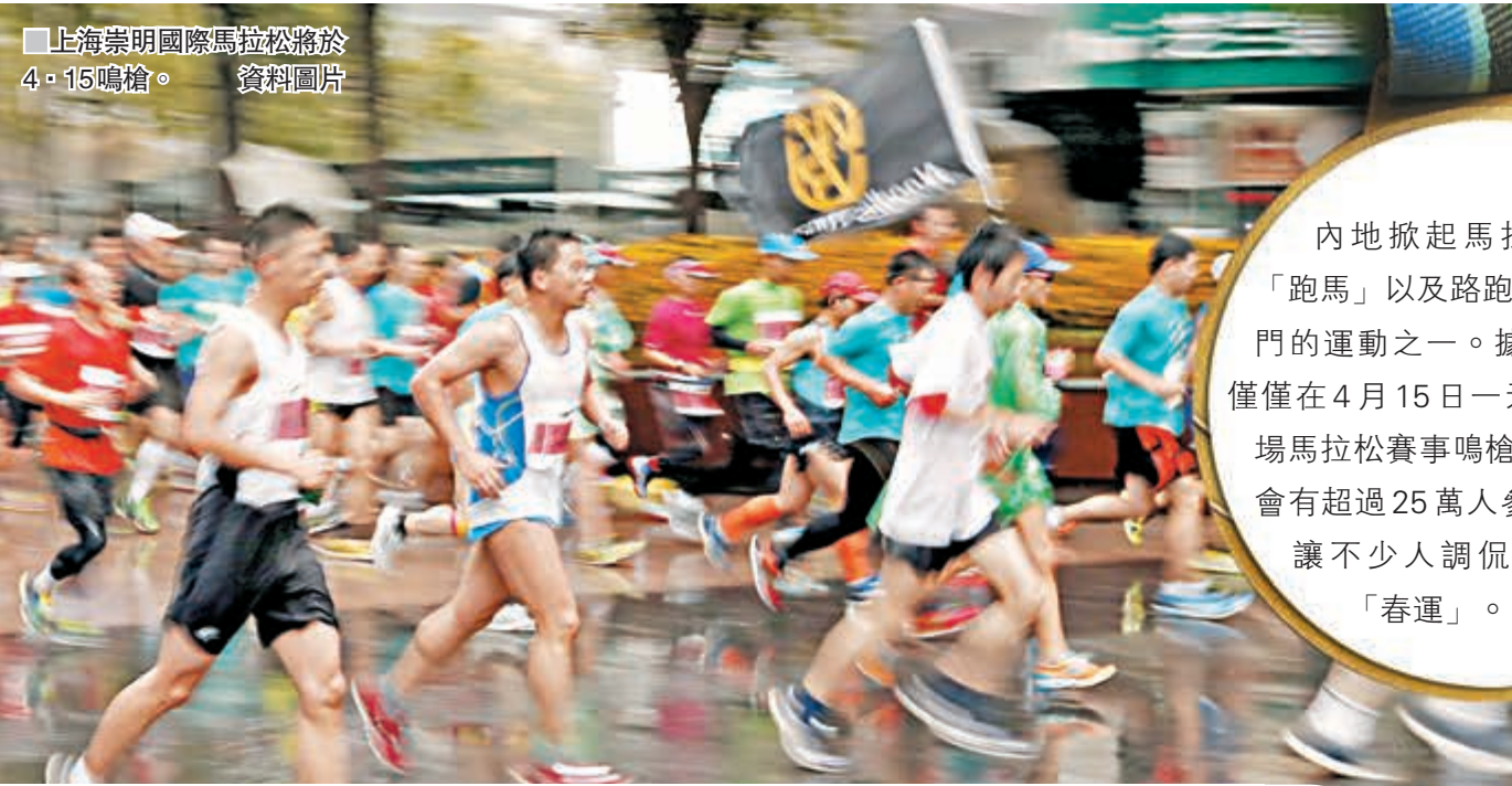
上海崇明國際馬拉松將於4·15鳴槍。 資料圖片