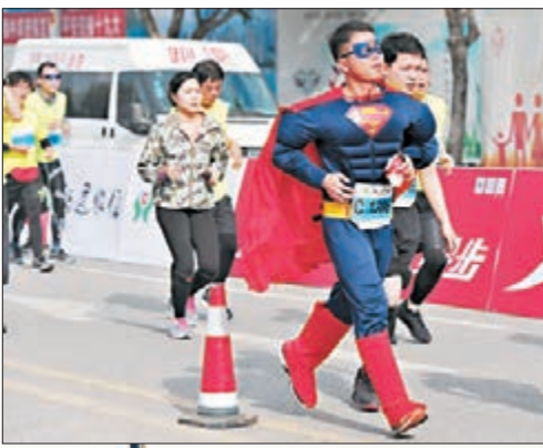
不少參賽者悉心打扮，寓比賽於娛樂。