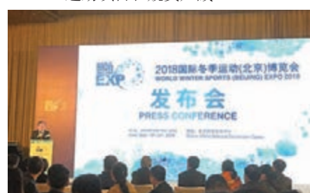
冬博會組委會昨午在京召開新聞發佈會。

隨著冬奧正式步入「北京周期」，中國冰雪產業在奧運機遇下蓬勃發展壯大。冬博會組委會指出，北京冬奧組委將連續三年亮相冬博會，通過北京2022年冬奧會和冬殘奧會主題展覽，讓更多的人了解冬奧會籌辦工作進展、賽區分佈和場館規劃、冬奧會、冬殘奧會運動項目和競賽知識。