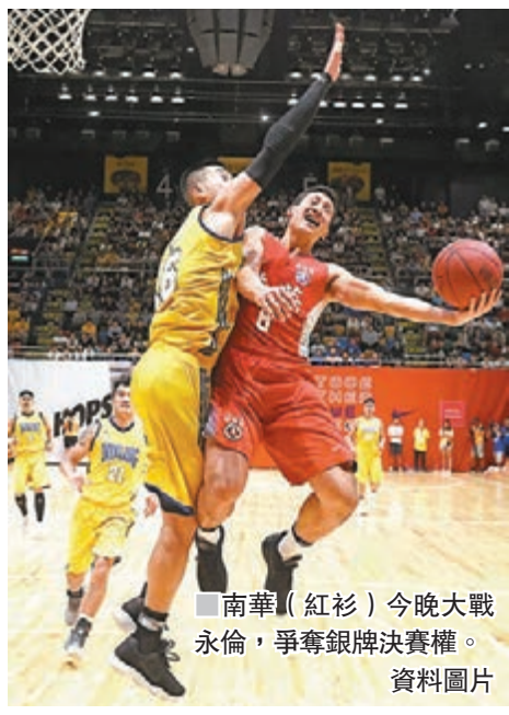
南華（紅衫）今晚大戰永倫，爭奪銀牌決賽權。 資料圖片

分身乏術的東方，明晚將在主場灣仔修頓擺陣，以衛冕身分繼續角逐ABL，於3場2勝的季後賽4強首回合賽事迎擊菲律賓火焰；但今晚的本地銀牌賽，如何調兵遣將考驗會方智慧。