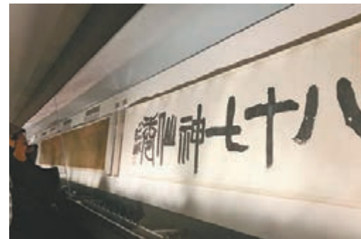
88歲齊白石題寫的「八十七神仙卷」卷名。