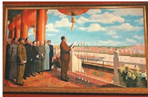
《開國大典》，董希文，複製品，1952年。