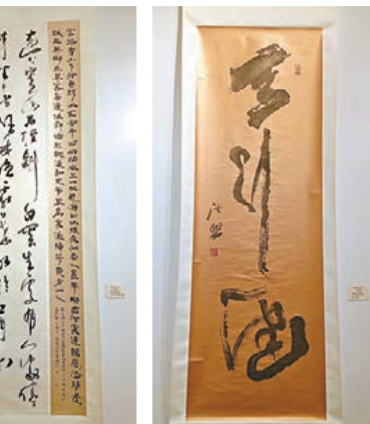
容浩然書法作品之一。