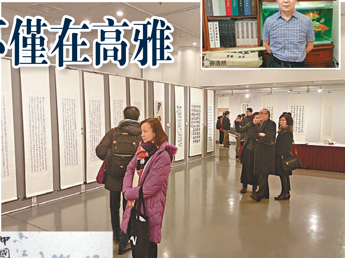
內地和本港民衆參觀中國香港書法學會會員作品展。