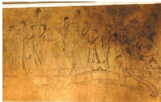
《八十七神仙卷》局部。