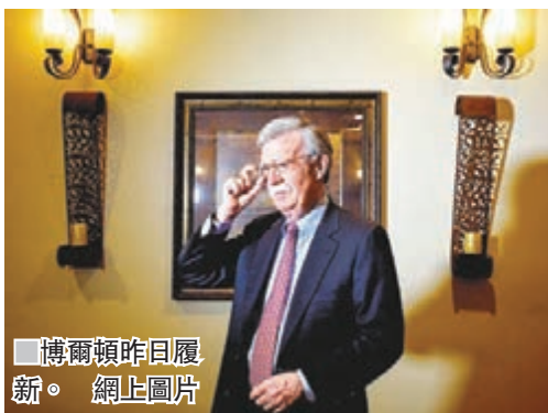
■ 博爾頓昨日履新。 網上圖片