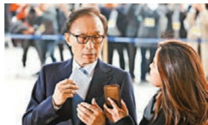
■ 李明博成韓國第4名因涉貪遭起訴的前總統。

韓國檢方昨日正式以受賄等罪名起訴前總統李明博，令他成為繼全斗煥、盧泰愚、朴槿惠後，韓國第4名因涉貪遭起訴的前總統。若罪名全部成立，李明博將面臨終身監禁。