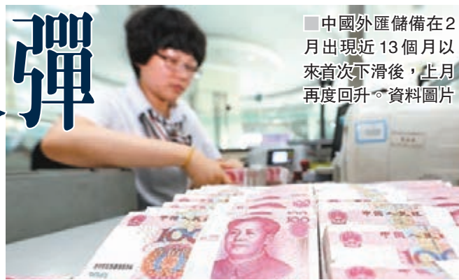
中國外匯儲備在2月出現近13個月以來首次下滑後,上月再度回升。

溫彬還指出,2月銀行代客結售匯差額由順差轉為逆差,銀行結售匯對外匯儲備規模增長的貢獻有限。但今年內人民幣兌美元累計升值超過3.2%,銀行代客遠期淨結匯逆差縮減至44.18億美元,說明人民幣貶